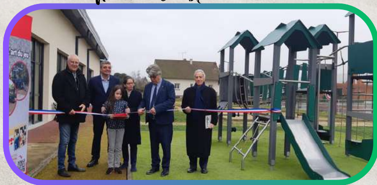
Inauguration aire de jeux