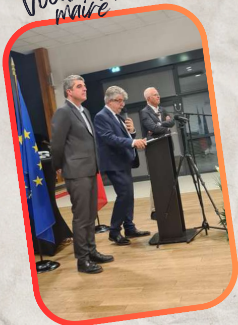
Voeux du maire